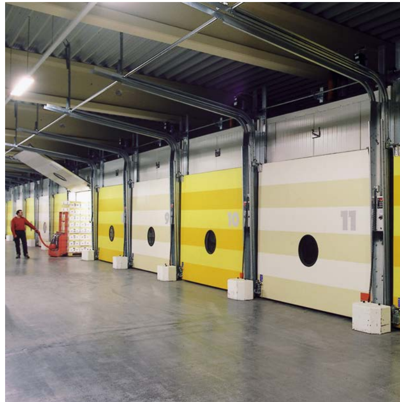
Reifekammer einstöckig mit Hubtor

Unsere gasdichten P+W-Hubtore werden aus eigener Entwicklung als Spezial-Bananenkammertore in hochisolierter Sandwich-Ausführung in unserem Werk hergestellt.