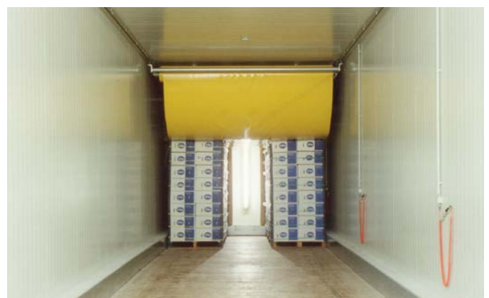
Reifekammer einstöckig mit Tuchabdeckung