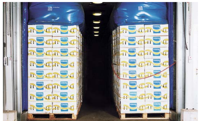
Reifekammer einstöckig mit Airbagtechnik