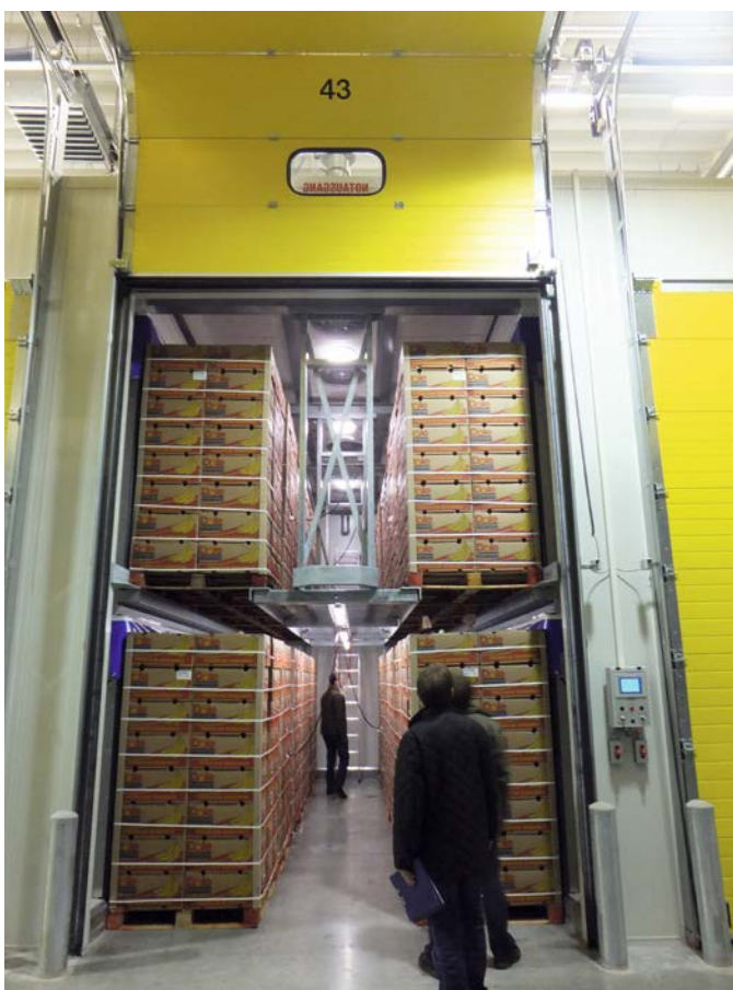
Reifekammer zweistöckig mit Sektionaltor und seitlicher Gardinenabschottung